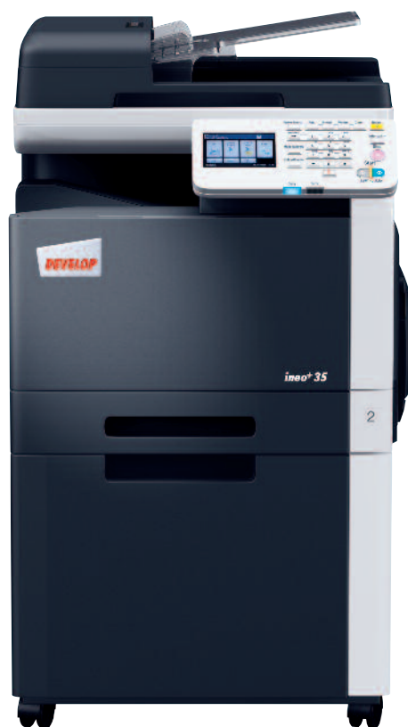
ineo + 35 se stolkem.

Provozní náklady jsou u ineo + 35 na obdobně nízké úrovni, jako mají multifunkce formátu A3. Navíc lze řídit práva k provozu jednotlivých uživatelů a to i vzdáleně, bez toho aby správce musel přijít až ke stroji. Software Data Administrator je synonymem všezahrnující správy účtů a dat. Zjednodušuje integraci nových zařízení do existující struktury a zjednodušuje nastavení adres e-mailů. Data pro autentizaci a účtování lze nastavit individuálně každému uživateli a to včetně omezení přístupových práv ke specifickým funkcím, jako je třeba barevný tisk. Pomocí nástroje Data Administrator můžete také ořezat náklady a limitovat výstupní náklady.