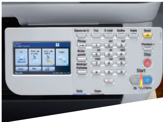
ineo+ 35 ovládací panel s barevným dotykovým displejem