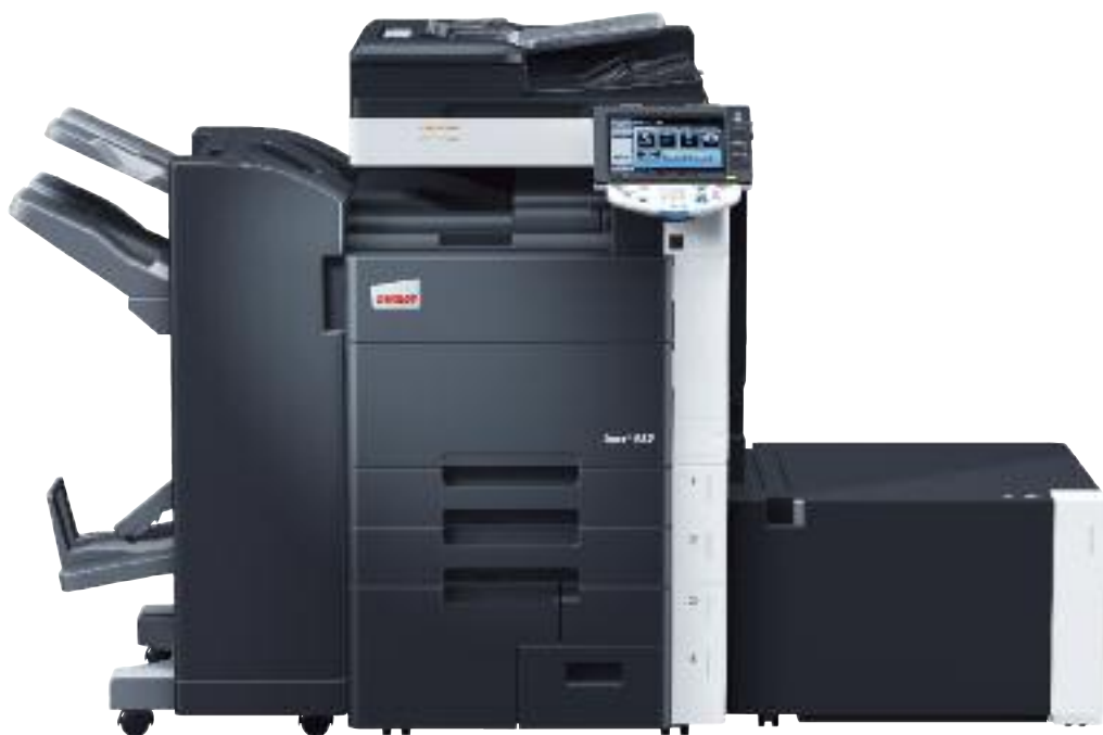
ineo+ 452 se sešivacím finišerem (FS-527), brožovacím modulem (SD-509) a velkokapacitním zásobníkem (LU-204)