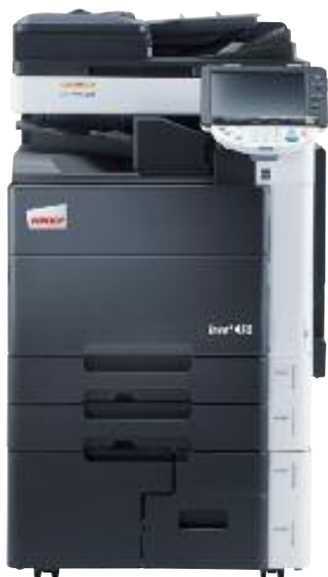
ineo+ 452 s oddělovací příhrádkou (JS-504)

Stroj ineo+ 452 nejenže vyhovuje ekologickým standardům Energy Star, německému Blue Angel, WEEE a RoHs, ale vyniká také dosud nejnížší spotřebou elektrické energie, dosaženou v této třídě produktů. To je možné především díky nejvyspělejším technologiím: polymerovaný toner umožňuje zapékání při nižších teplotách, jejichž zdrojem je indukční ohřev s velmi rychlým náběhem teploty. Zahřívání je touto technologií zkráceno na pouhých 30 sekund při velmi příznivé spotřebě energie. V jediném stroji se tak kombinují nejnovější technologie a vyspělé softwarové aplikace s nadprůměrnou kvalitou v barevném i černobílém tisku a s celkovou přívětivostí k životnímu prostředí.