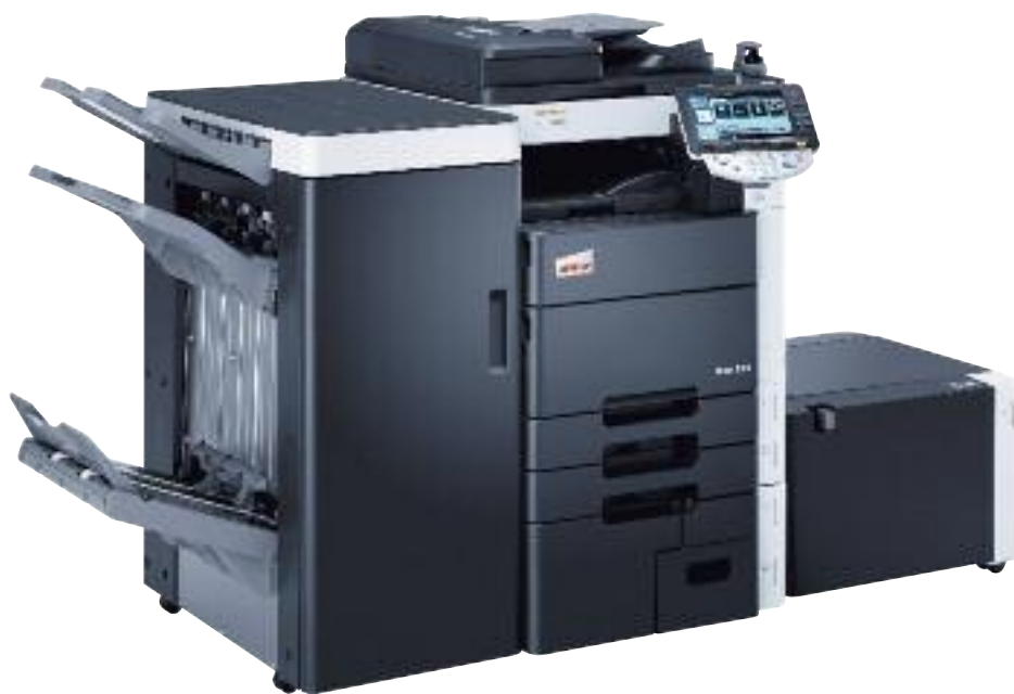
ineo+ 552 se sešivacím finišerem (FS-526), brožovacím modulem (SD-508), pracovní deskou (WT-506), biometrickou autentizací (AU-102) a velkokapacitním zásobníkem (LU-204)