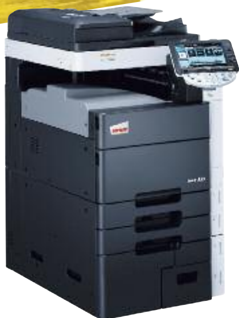
ineo+ 552 s výstupní přihrádkou (OT-503)